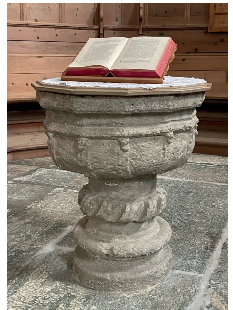
Taufstein Kirche San Niculò Pontresina